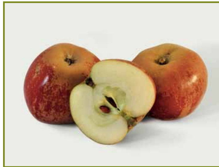
Rotfranch Apfel des Jahres 2012