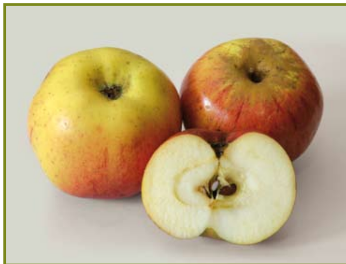
Stina Lohmann Apfel des Jahres 2009